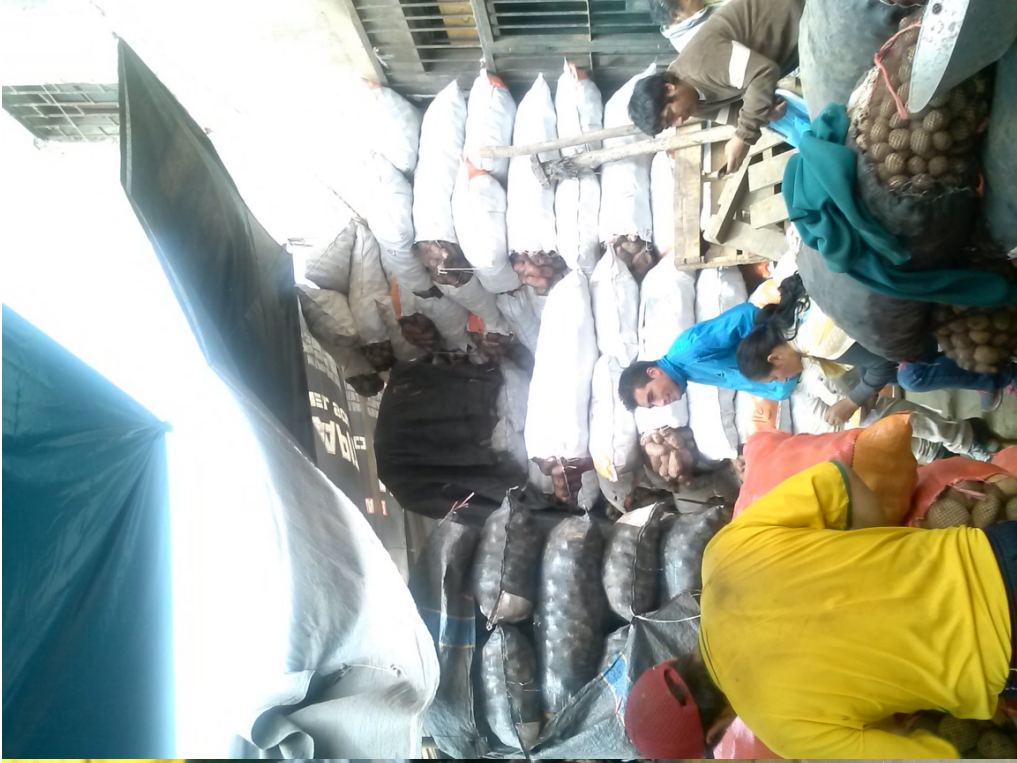
Puestos de papas. En los años 80 los exitosos comerciantes mayoristas eran conocidos como los “Reyes de la Papa”.