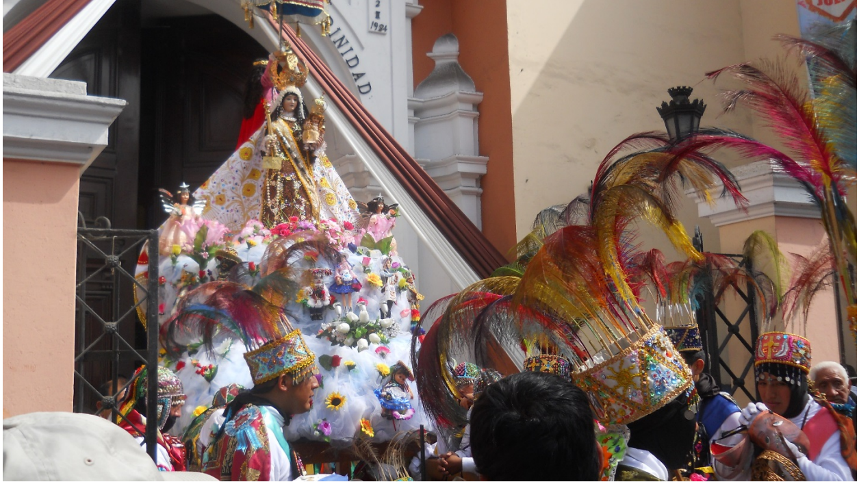
La Mamacha del Carmen guardándose en el Santuario de la Santísima Trinidad (1574) en la Avenida Emancipación del antiguo centro de Lima.