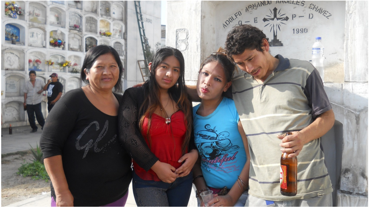
Familia de fans “chacaloneros”. Aniversario vigésimo primero.