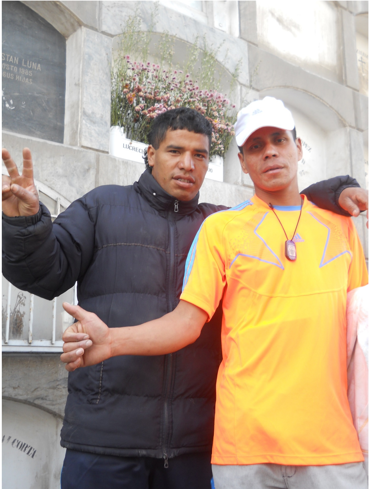
Fans “Chacaloneros” encargados de las bombardas en las Romerías.