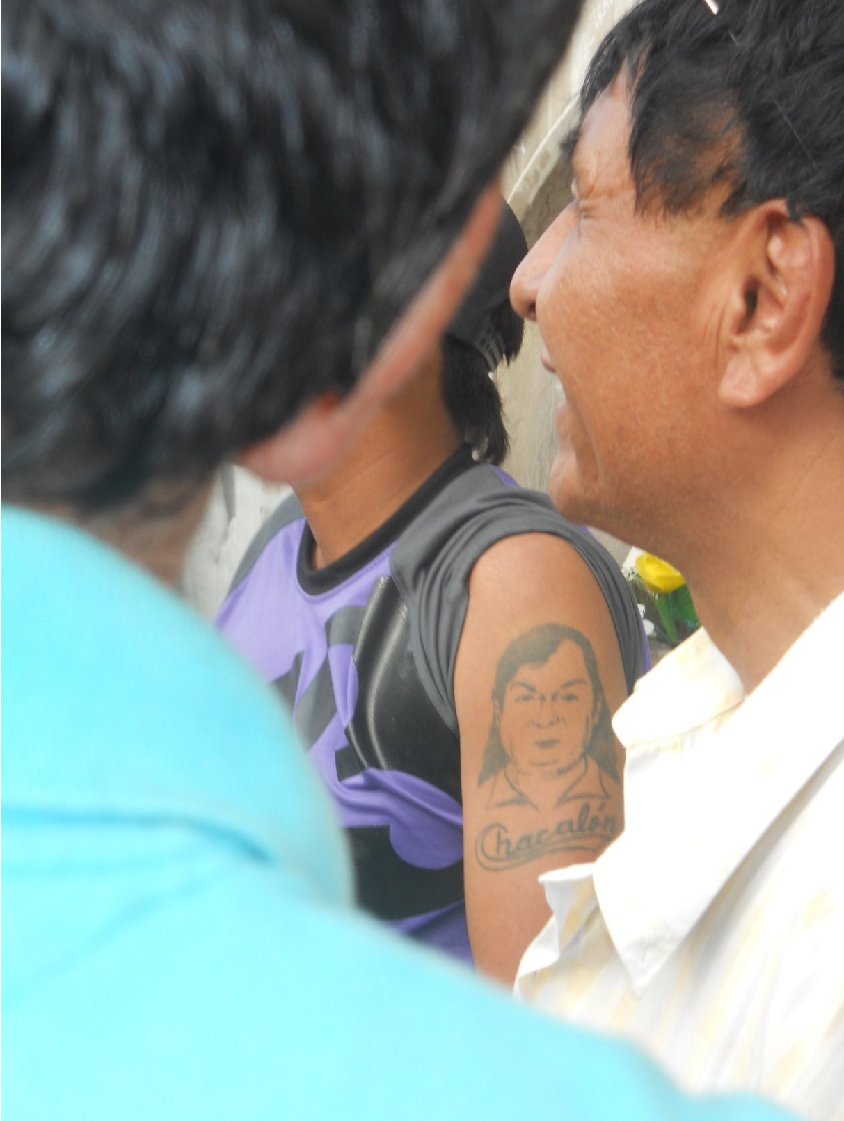
Tatuaje de Lorenzo Palacios "Chacalón" en brazo de un fan. Aniversario 20.