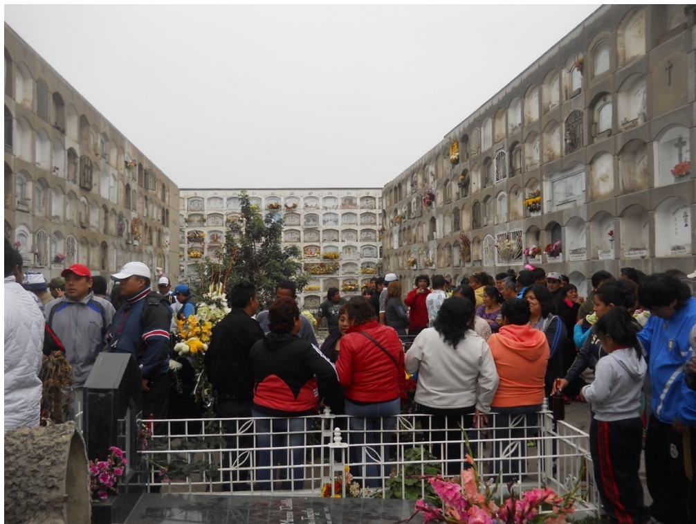
Romería a la tumba de Lorenzo Palacios Quispe "Chacalón". Cementerio El Ángel. Barrios Altos. Cercado de Lima.