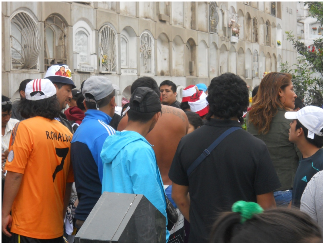
Después de quitarse la camiseta se lee el tatuaje de su espalda "CHACALONERO".