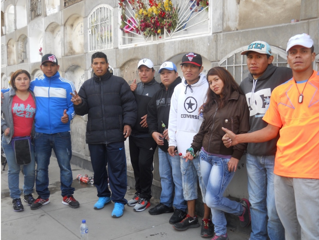
Juventud de Fans “Chacaloneros” en Romería. Aniversario 20.