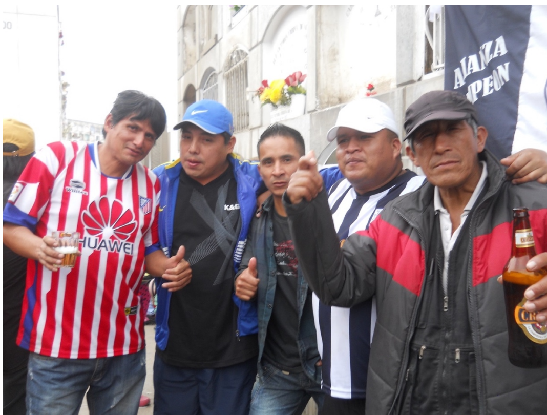
Grupo de “aliancistas” y fans chcaloneros. Aniversario 20.