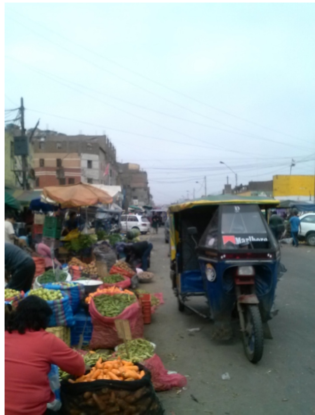
Entrada al Mercado Mayorista. Sección de verduras. La tranquilidad de la mañana opuesta al bullicio del amanecer.