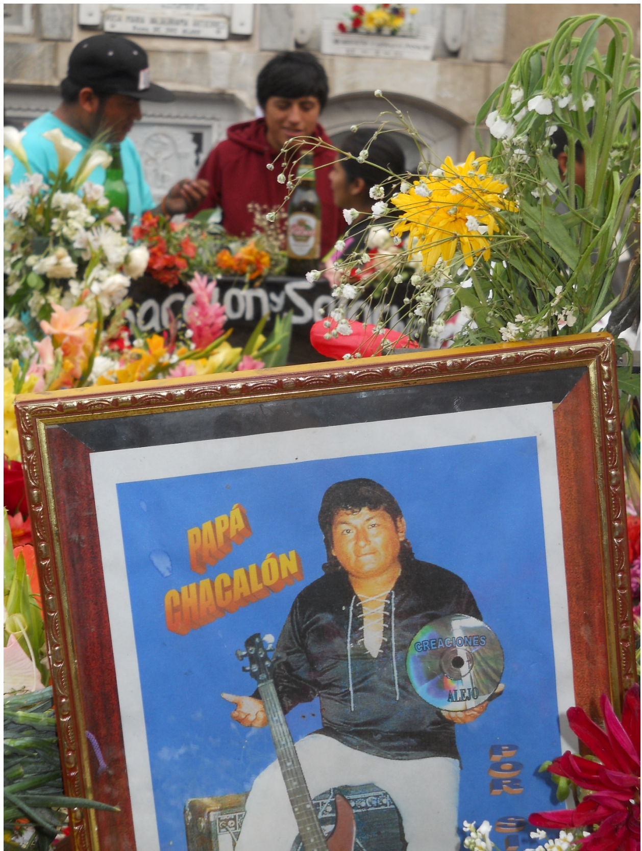
Retrato de Lorenzo Palacios Quispe "Papá Chacalón" levantado sobre su tumba. Aniversario 20.