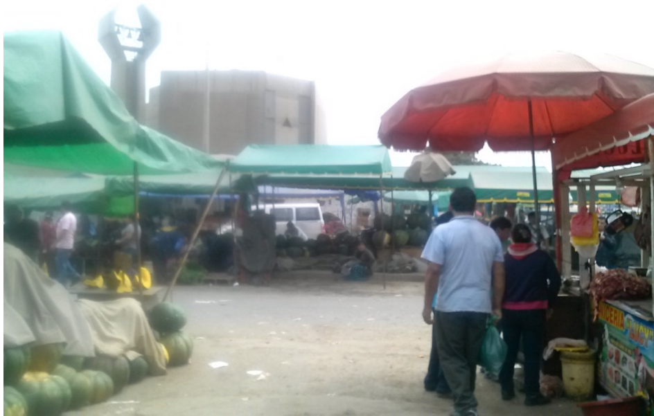
Puestos de la sección de Calabazas y de jugos del Mercado de La Parada.