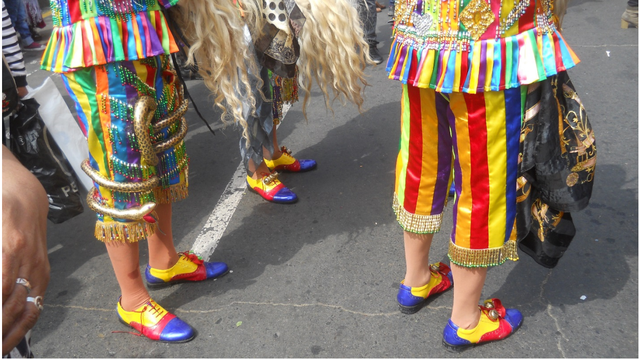
La costosa vestimenta de los Saqras exhibe colores andinos de carnaval y símbolos mitológicos.