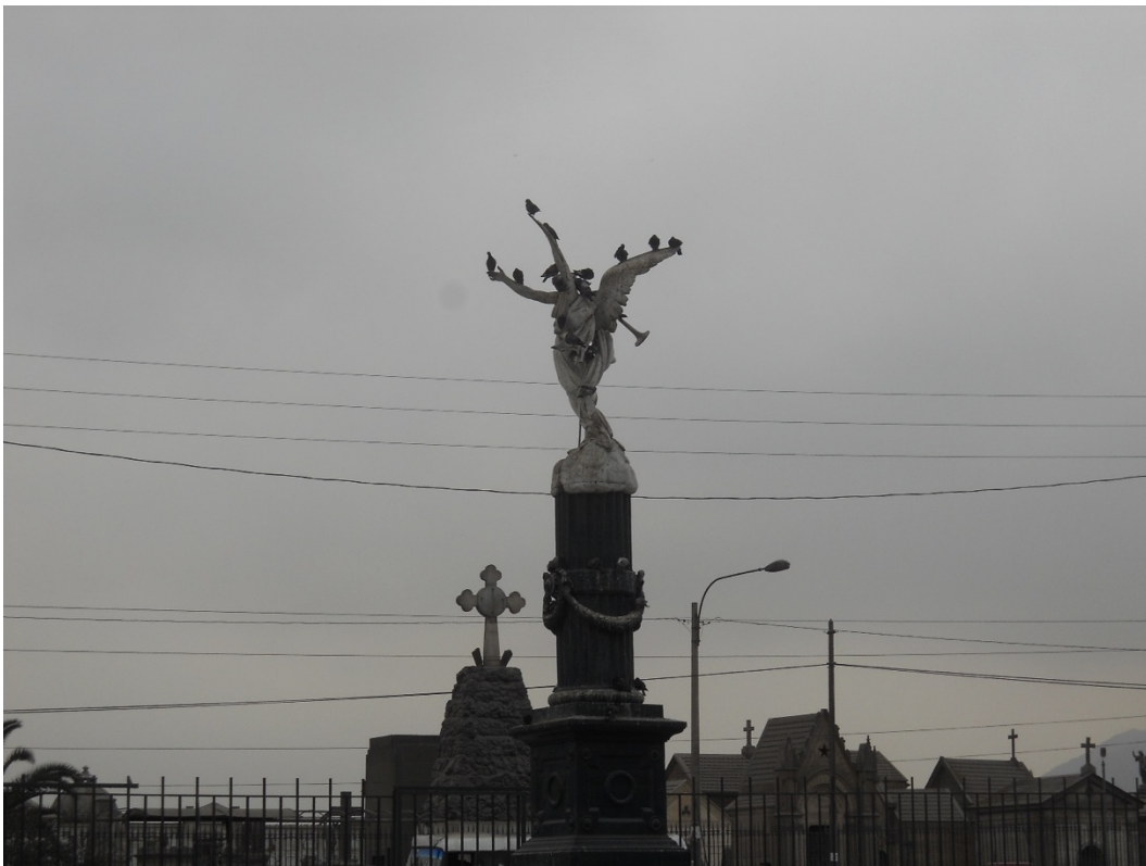
Cementerio El Ángel. Barios Altos. Cercado de Lima. Junio 2014.