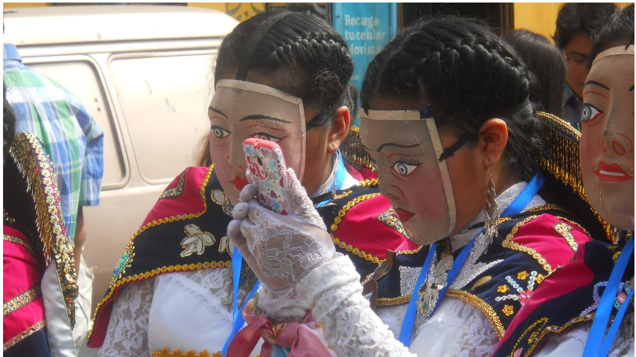
Las yoyacha “millennium” navegando en la red con sus teléfonos celulares.