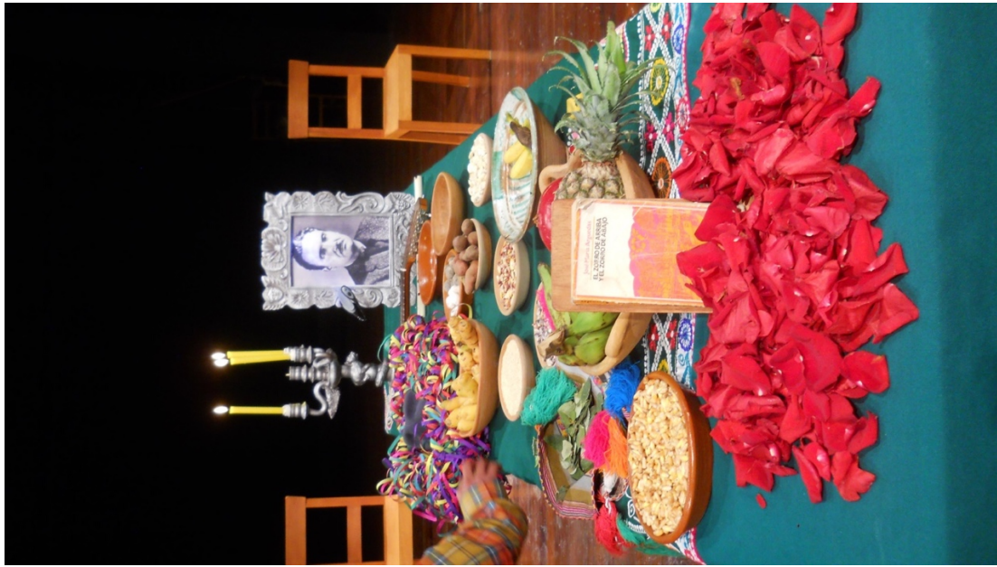
Mesa para José María Arguedas. Escena Final de la obra teatral “Cartas de Chimbote” del grupo teatral Yuyachkani. Magdalena, Lima. Julio 2015.