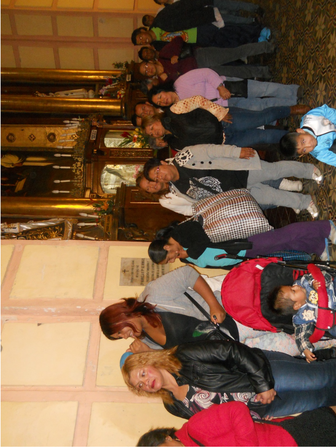
Cola para el pésame y recibir el recuerdo. En el Aniversario 20, el recuerdo fue un vaso chop de cerveza.