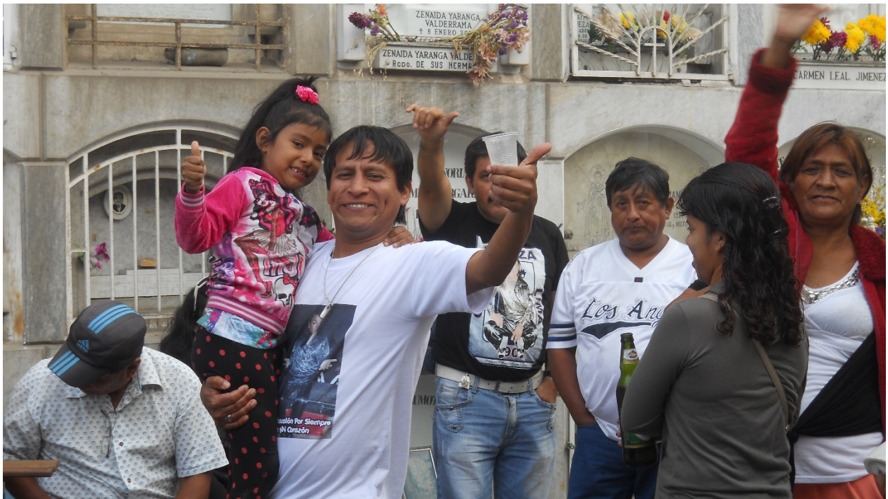
Las generaciones más jóvenes participan de la tradición de La Romería a Papá Chacalón.