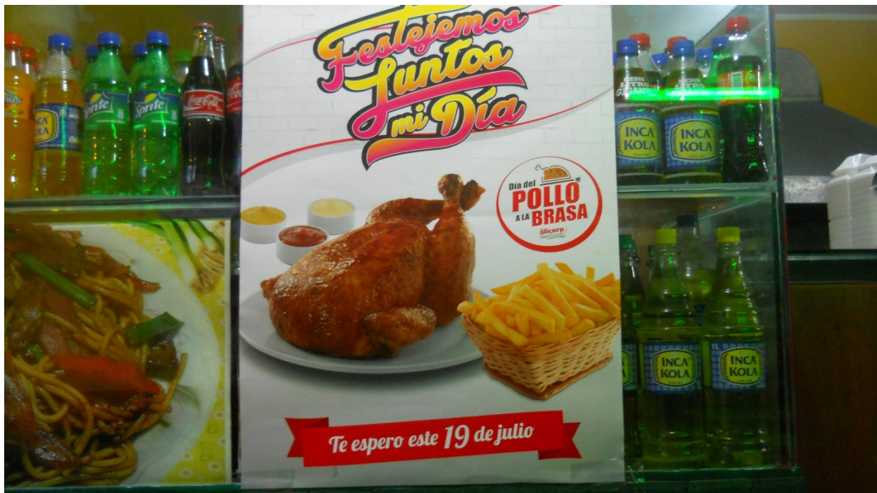
Día del "Pollo a la brasa", típico plato peruano con la caligrafía de los carteles chicha. 2014.