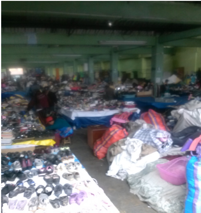
Tacora. Legendario comercio de segunda mano. En el imaginario, emporio de artículos robados y delincuencia.