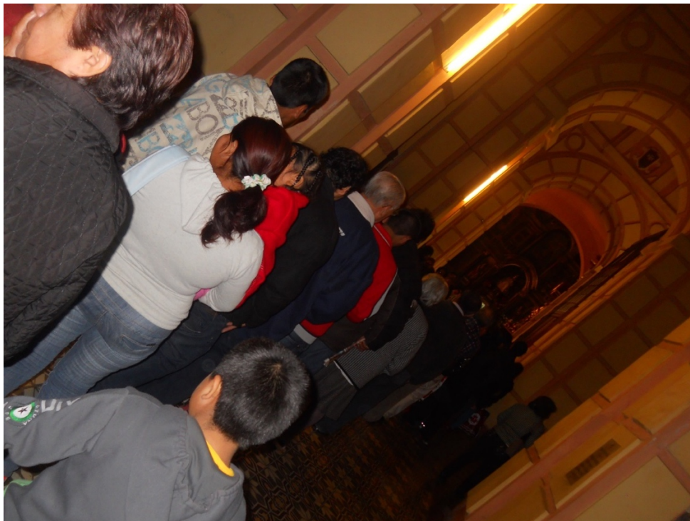
Cola para el pésame y recibir los recuerdos. En el 2013, el recuerdo fue un plato con parantes.