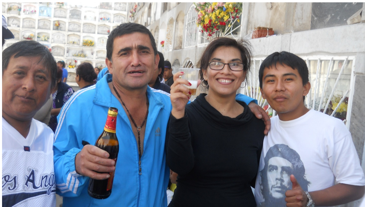
Un momento de celebración junto al pueblo “chacalonero”. Brindando por Papá Chacalón.