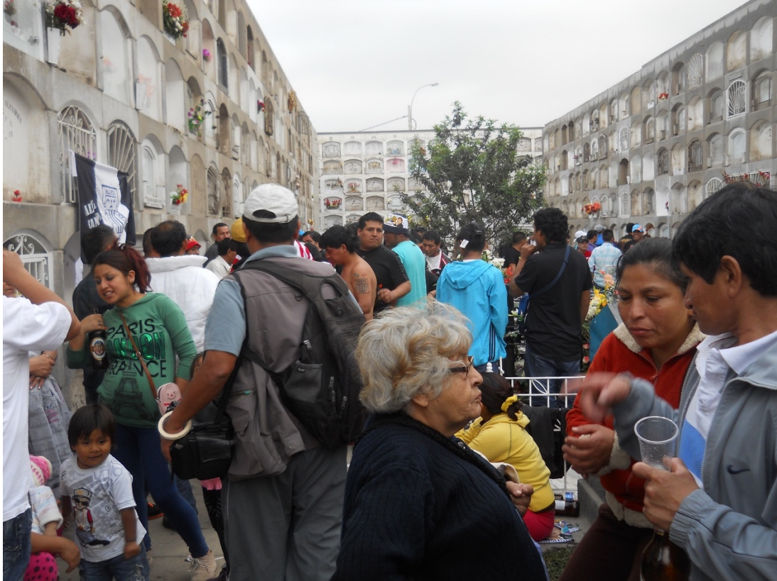
Todas la generaciones de fans de Lorenzo Palacios Quispe “Papá Chacalón” en su 20 Aniversario.