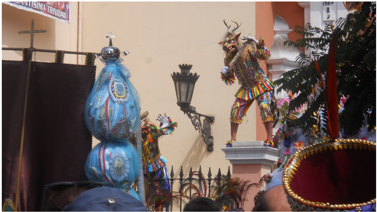
Los “Saqras” (Diablos) vienen a acompañar a la procesión de la Virgen. Vestidura colonial.