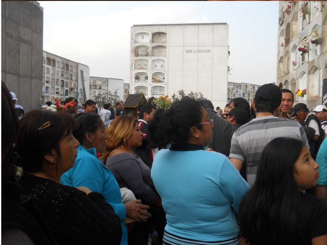
Público femenino, fans de Chacalón. Aniversario 20.