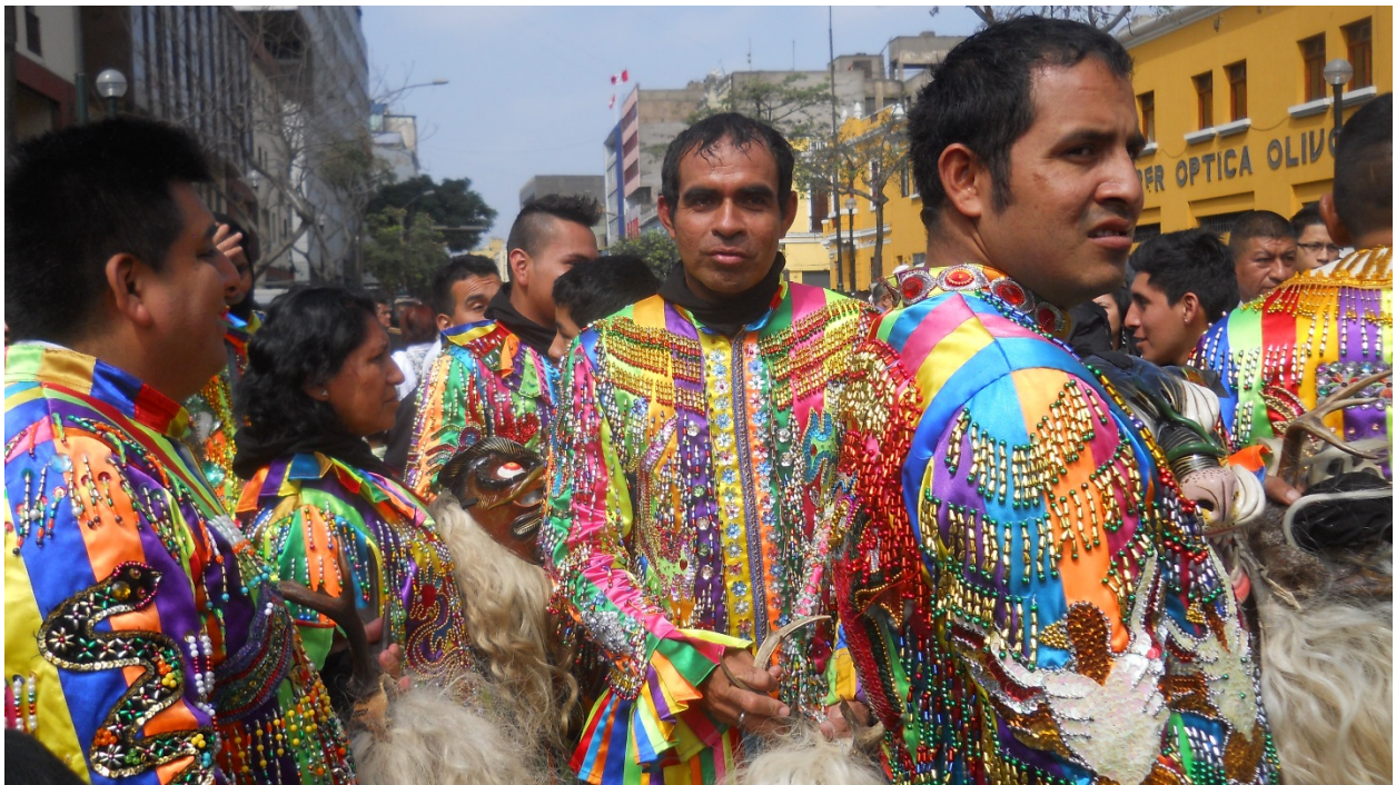
El diseño barroco del traje consta de piedras y cintas enteramente tejidas a mano. El encargo se estima entre mil o dos mil dólares.