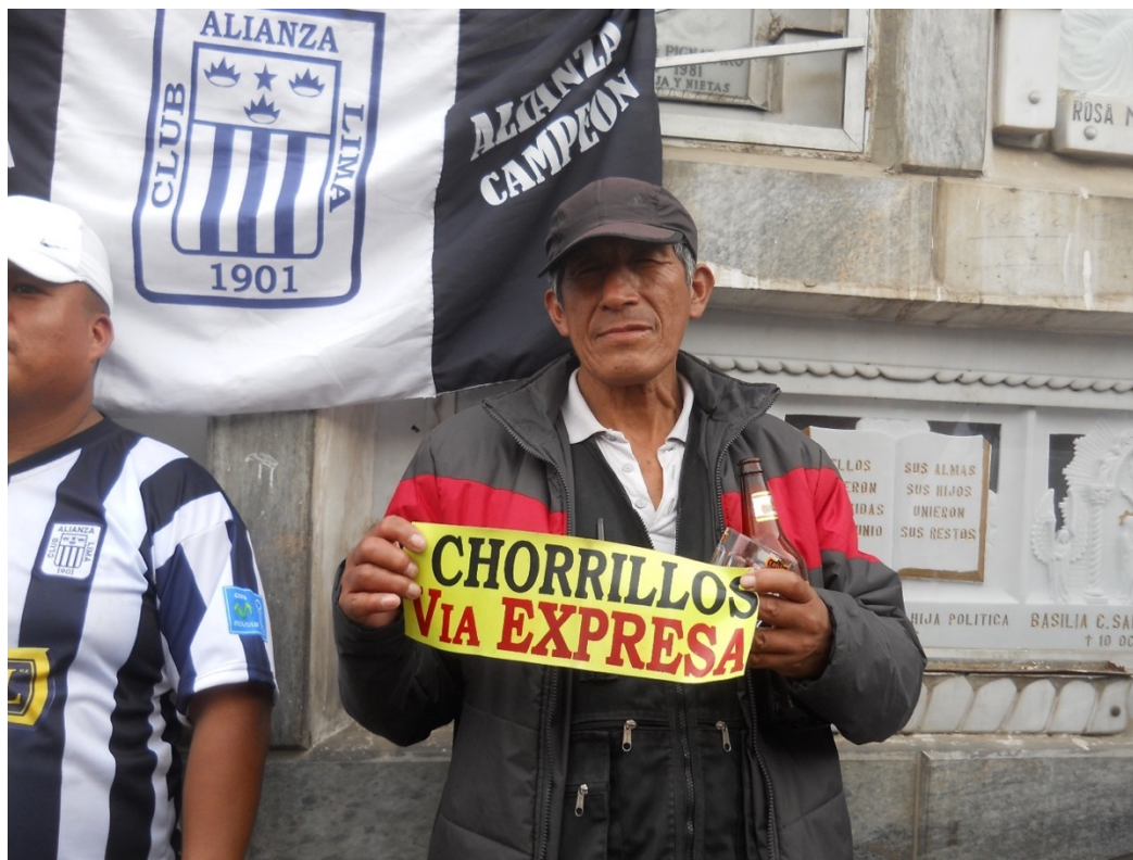
Personaje de la ciudad de Lima. Llenador de colectivos Lima-Chorrillos desde los 80's.