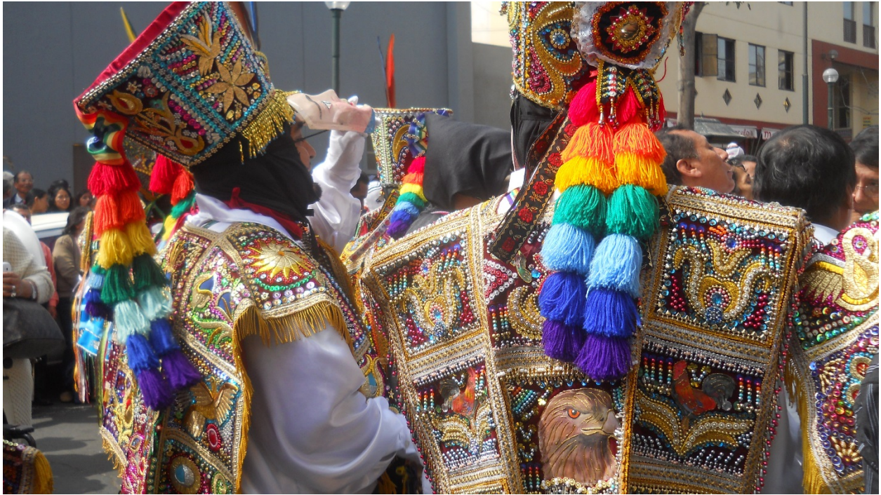
Los “Danzaq” en la Fiesta de la Virgen del Carmen o Mamacha del Carmen de Paucartambo, Cuzco en la Avenida Emancipación del centro de Lima.

LLEGAN A LIMA REMOVIÉNDOLA CON SU MÚSICA. 2015.