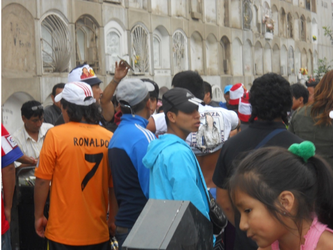
Momento en que un fan chacalonero se quita la camiseta aliancista con el retrato de Papá Chacalón.