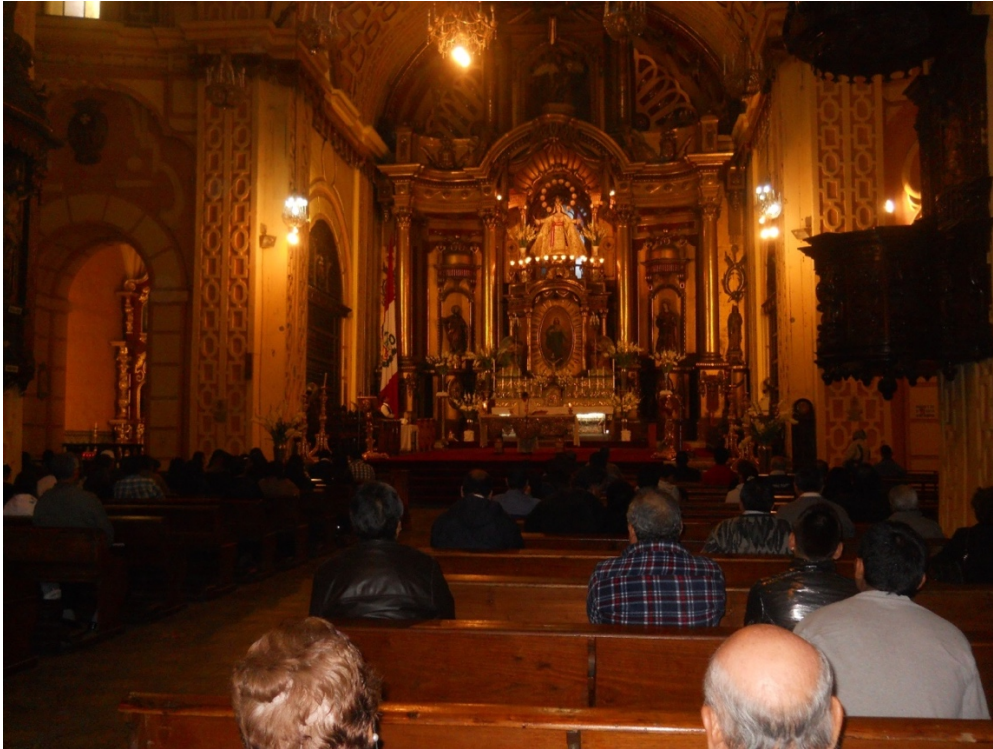
24 de junio de 2013. Misa en la Iglesia La Merced. Jirón de la Unión. Centro de Lima.