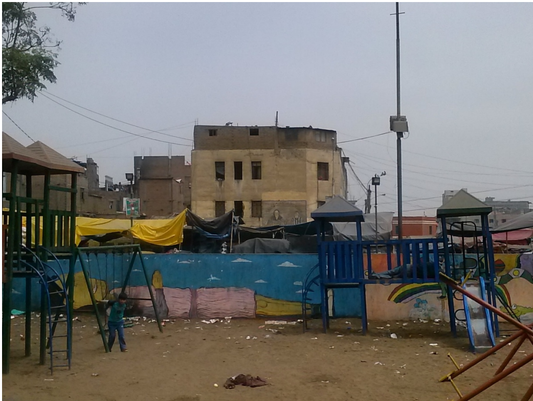
Parque de juego infantil. Al fondo la imagen del Mural.