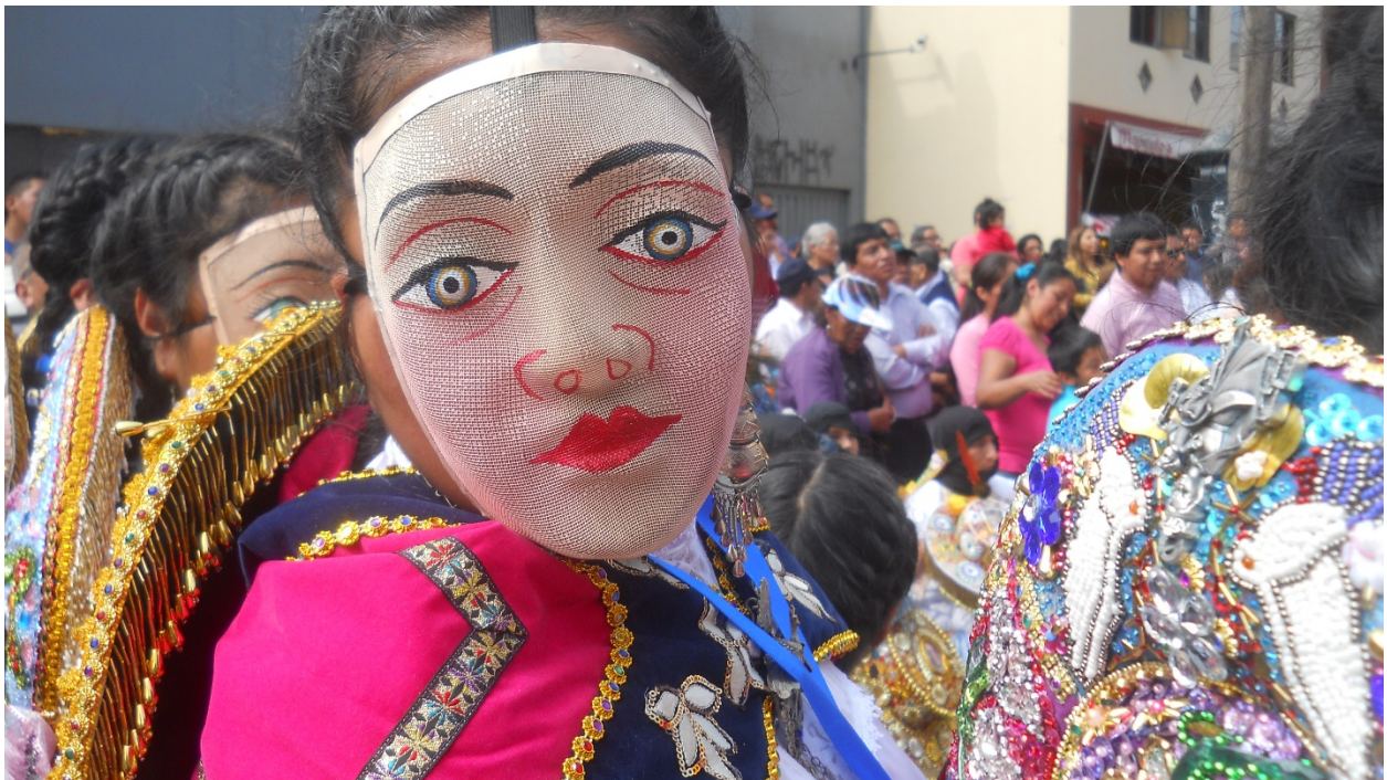
La Qoyacha representa a la juventud. Las muchachas y muchachos solteros.