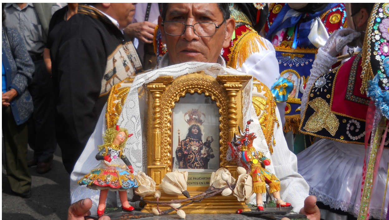
El pequeño arca es de los devotos de Paucartambo Residentes en Lima, custodiado por el mayordomo.