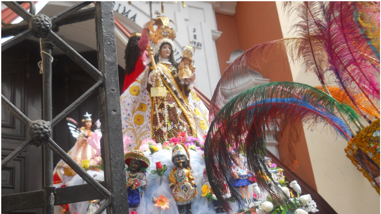
“Hasta el año venidero”, cantan los danzantes. Se despiden la “Señoracha” adornada con los Qhapac Negro y entre las plumas de los chunchos (de la Amazonia), los guardianes que nunca se separan de su lado.