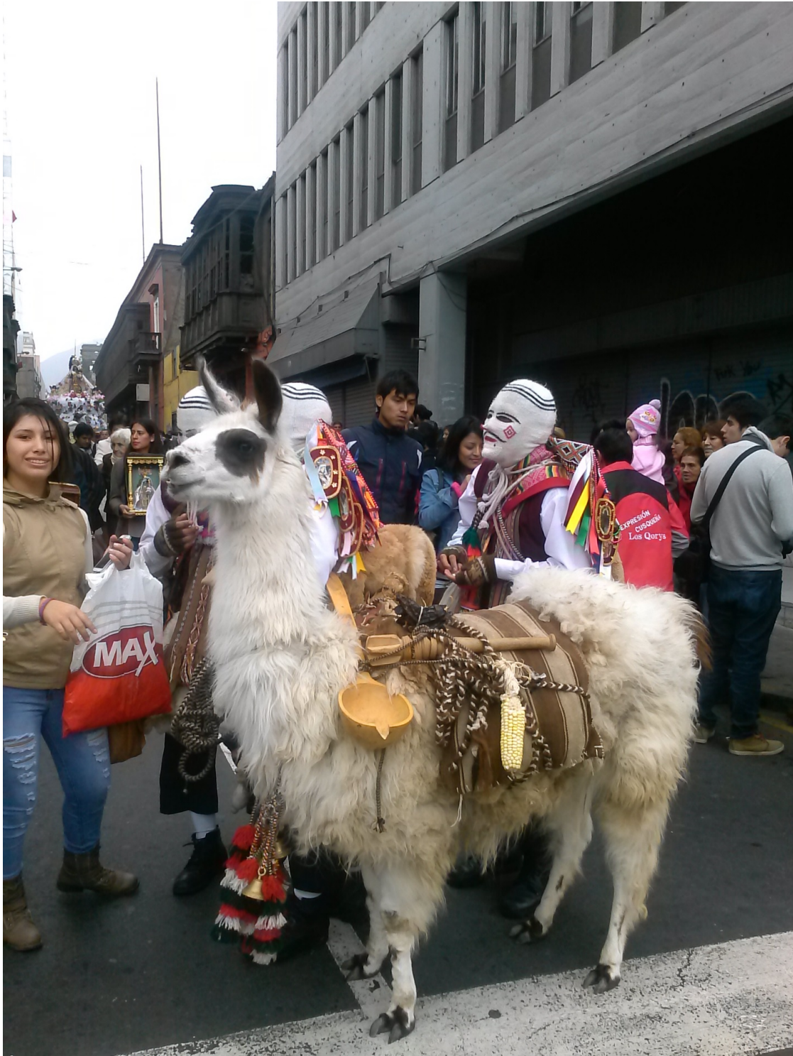
Los juguetones “Qollas” en el centro de Lima. Salida a la Avenida Emancipación. Personajes de la Fiesta de la Virgen del Carmen de Paucartambo (Cuzco). Julio de 2014.