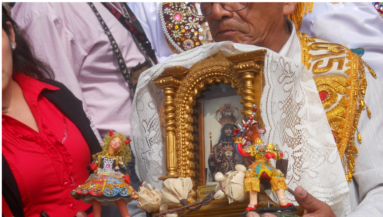
El altar portátil de la Mamacha del Carmen es de oro y le acompañan una diabla y un ser mitológico.