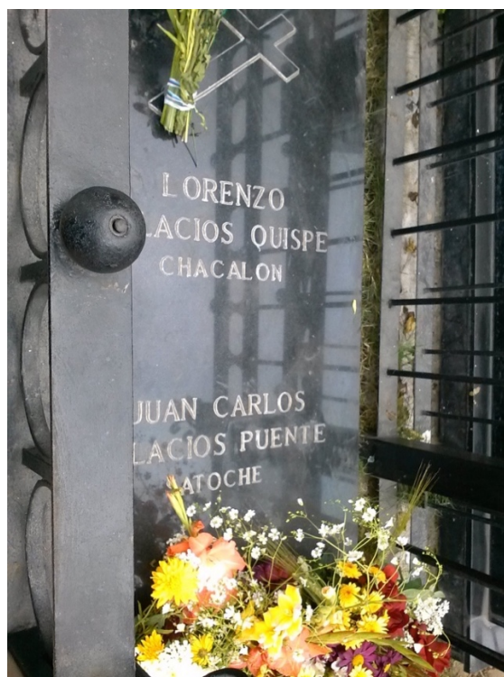
Tumba de Lorenzo Palacios Quispe “Chacalón” y Juan Carlos Palacios Puentes “Satoche”