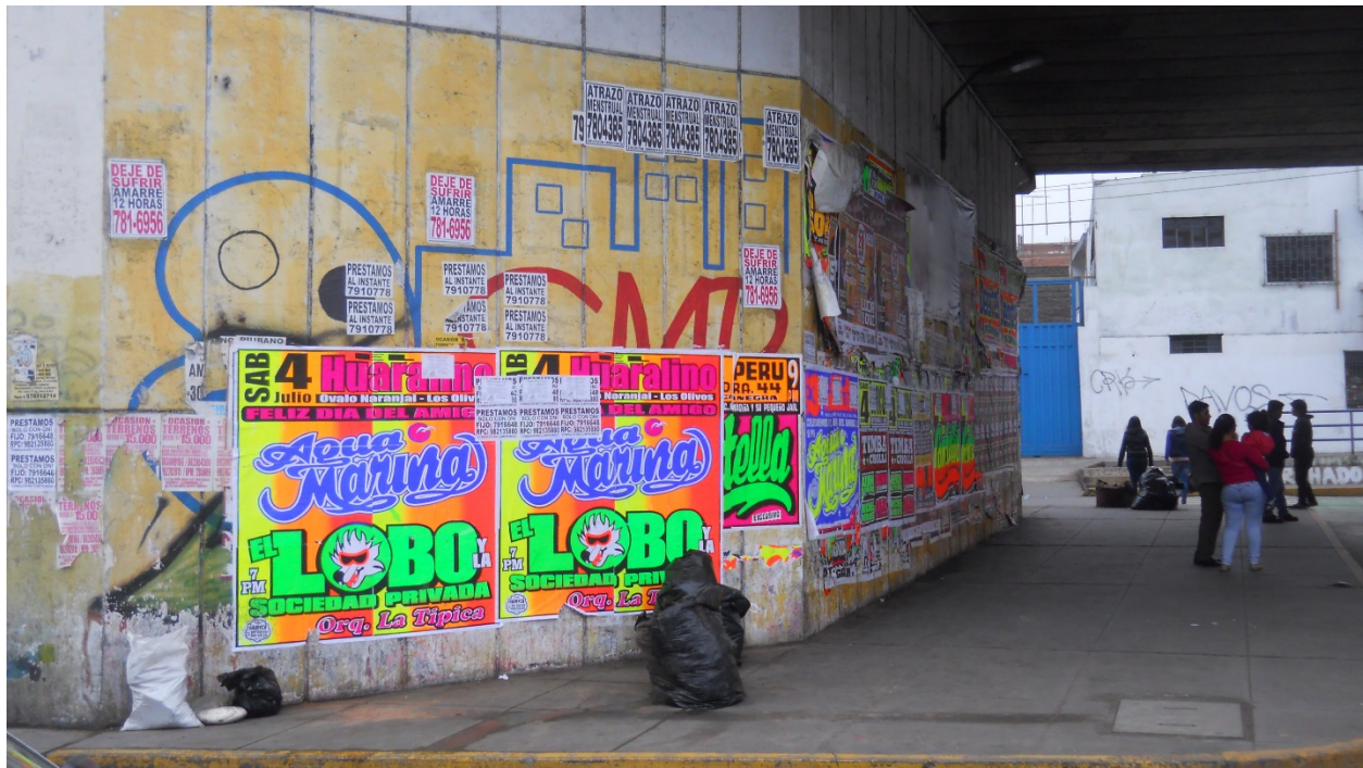
Afiches de conciertos de tecnocumbia. Puente Av. Venezuela y Av. Universitaria, Lima. 2014.