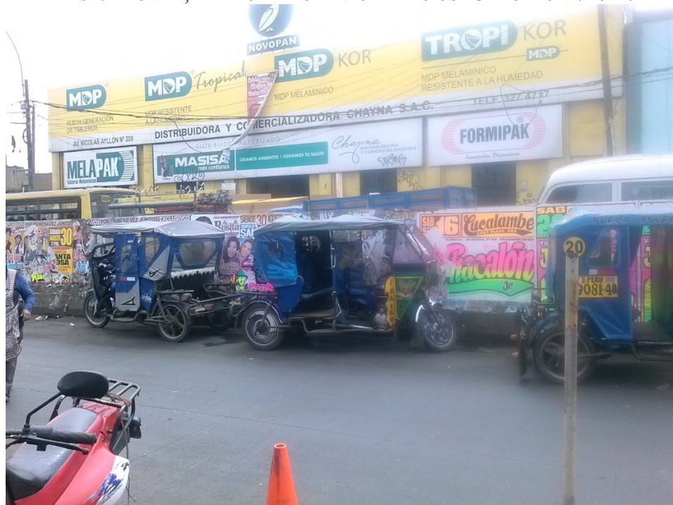
Fila de Moto Taxis a la entrada del Mercado Mayorista. Distrito de La Victoria.