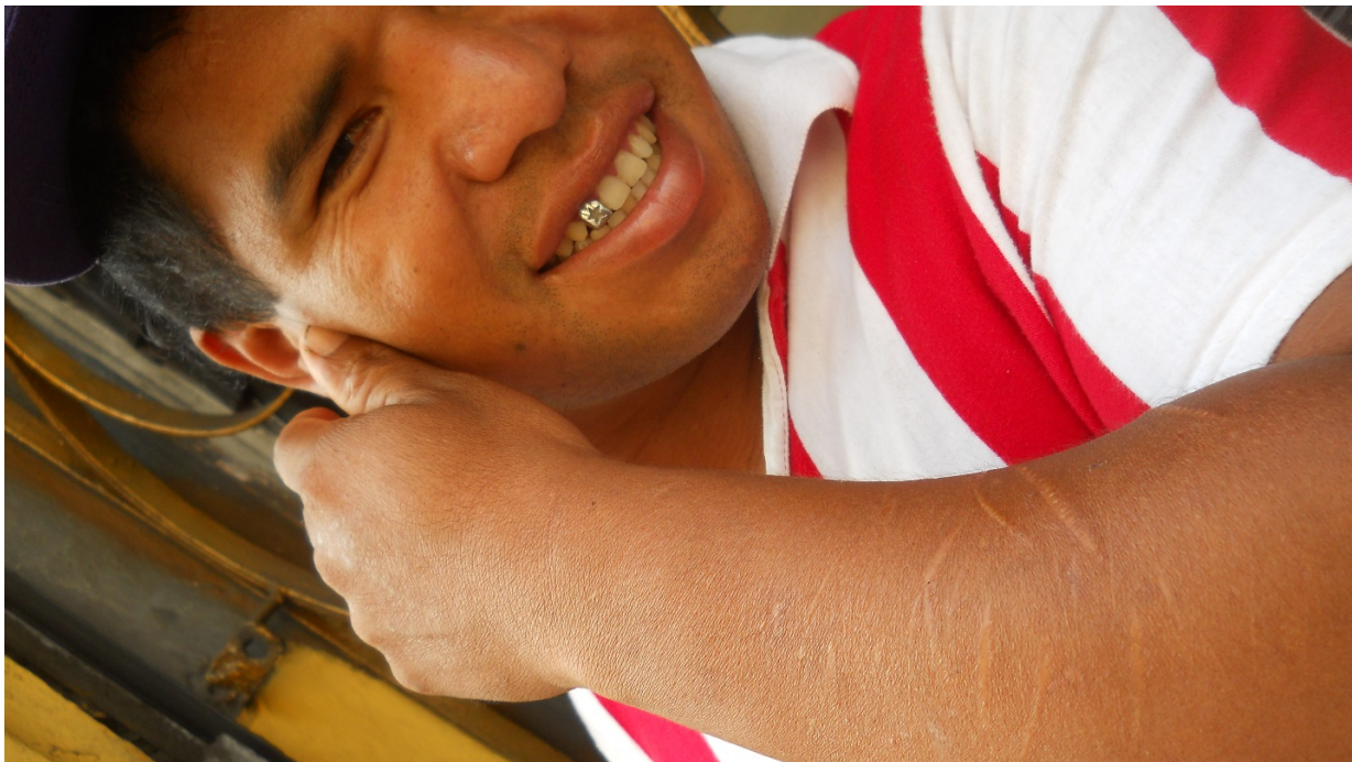
La escritura de un fan chacalonero: “hasta el día de mi muerte... siempre voy a ser chacalonero”.