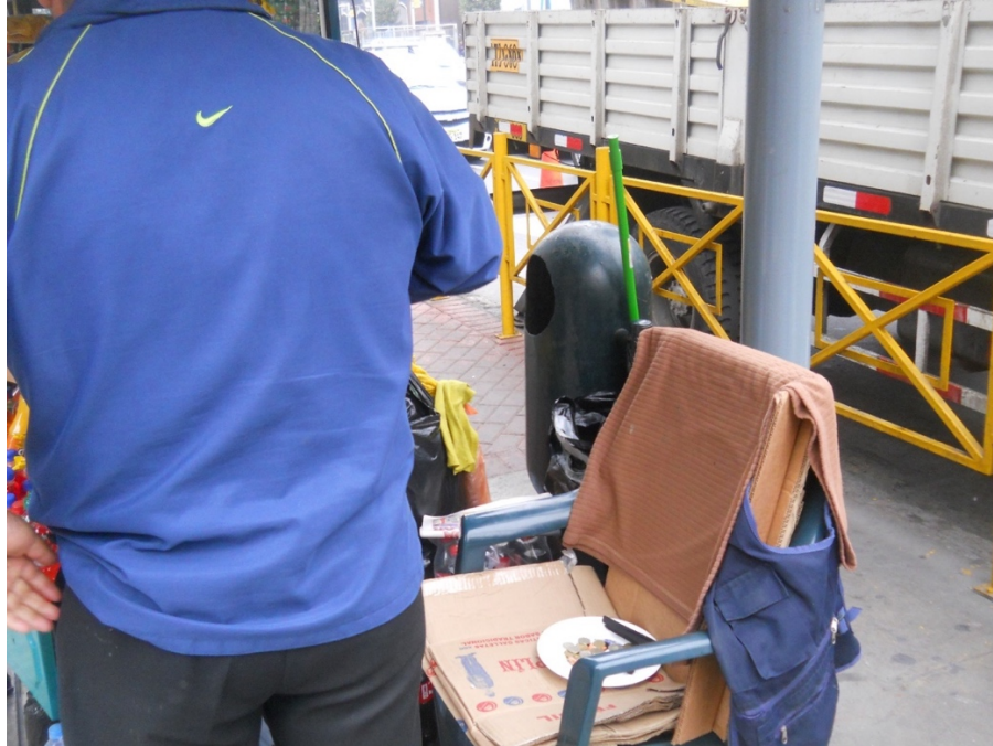
Asistente a la Misa de Chacalón. El plato del recuerdo usado para las monedas en su puesto ambulante.